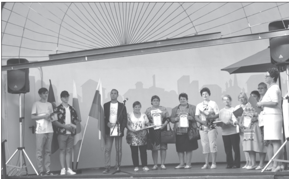
Награждённые за вклад в благоустройство дворовых территорий