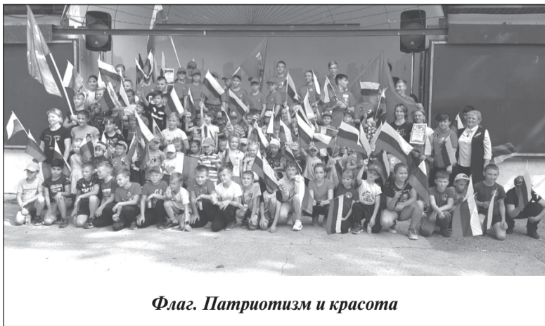
Флаг. Патриотизм и красота

К этому дню во всех городах и весях нашей страны проходят мероприятия, призванные подчеркнуть значимость этого государственного символа, его важного места в воспитании патриотизма. В Приволжье праздник всегда отмечается в торжественной обстановке, с обязательным участием детей и молодёжи — разве