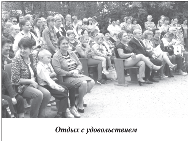
Отдых с удовольствием

Организаторы благодарят всех спонсоров, которые помогли в проведении праздника.