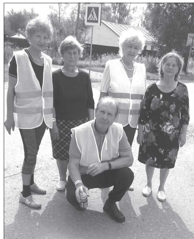
Прочитав предупреждение, возьми его за правило

Нанесение трафаретов - лишь часть плана серебряных волонтеров по снижению аварийности и смертности на дорогах города. Также в план работы волонтерского отряда входят профилактические беседы с населением, направленные на соблюдение правил дорожного движения, раздача буклетов и светоотражателей.