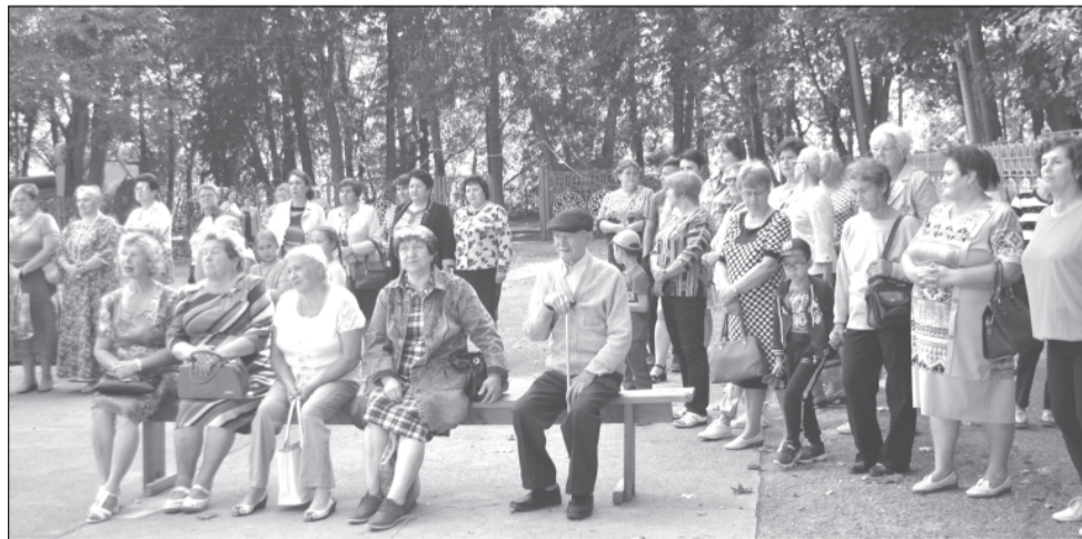
Забыв про дела, гости слушали хорошие песни

Совета Приволжского городского поселения и Приволжского районного отделения «ЕР» и подарки от спонсоров, были видны и молодые люди, и даже мужчины. Пос-