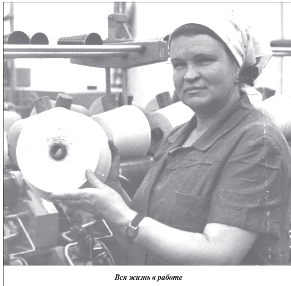
Вся жизнь в работе