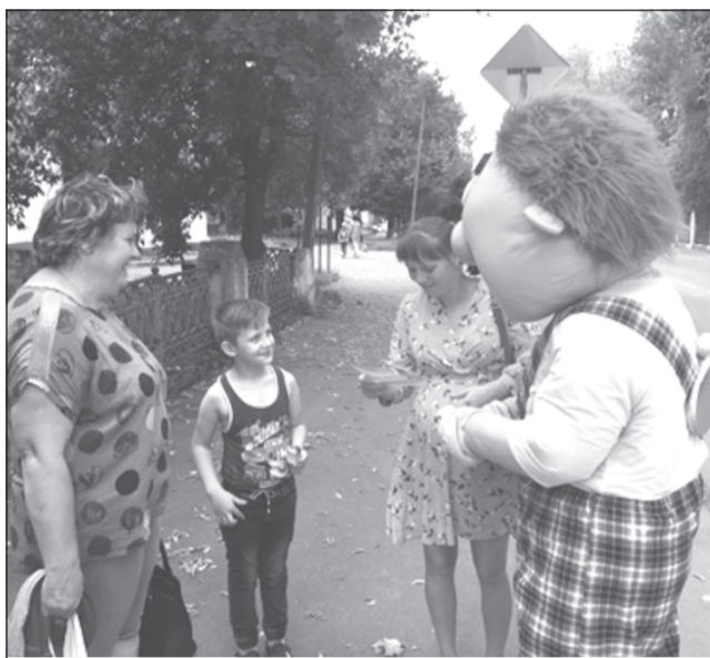
Дорожные правила, которые рассказывает сказочный Карлсон, запоминаются быстрее

В городе на оживленных пешеходных переходах внимание участников дорожного движения привлёк необычный патруль в составе ростовой куклы, волонтеров и ав-