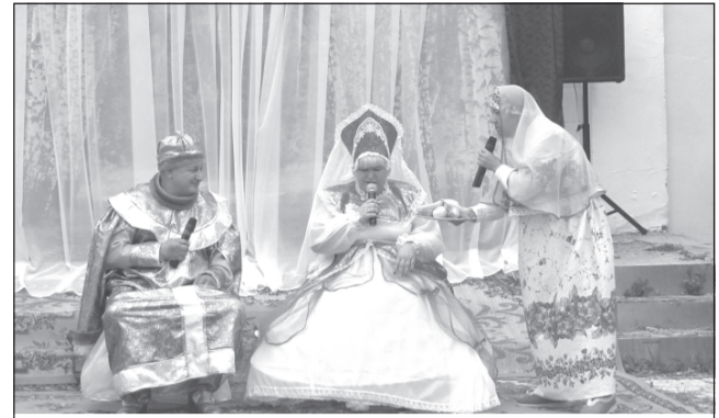
Главные персонажи сказки