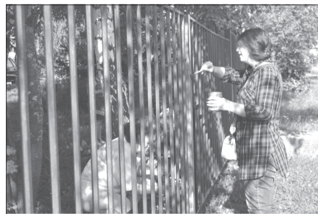
Педагоги, окуните ваши кисти...