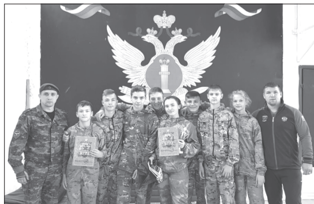
Навыки, полученные в клубе «Витязь», пригодятся во взрослой жизни

Наши ребята из клуба «Витязь» достойно выступили и показали отличный результат в огневой, строевой, медицинской, физподготовке, в знании истории.