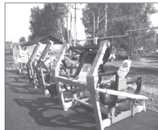
Новые тренажеры ждут желающих размяться

Два дня назад сквер пополнился молодыми саженцами сосны, их на аллее посадили сотрудники МЧС. Темп задан высокий, благодаря этому объект будет введен в эксплуатацию в срок, в соответствии с договором.