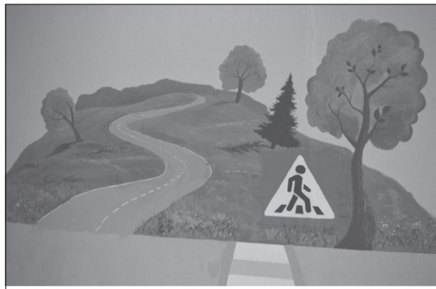
Рисунок на стене тоже учит

разовательная среда» или «Креативное пространство». Этот проект — многогранный. В его рамках на каждом этаже школы уже появились зелёные зоны, а на стенах коридоров — рисунки детской познавательной тематики. В соответствии с замыслом, на стенах возле библиотеки ожили сказочные герои книг, а на втором этаже полным ходом идёт работа по созданию «дорожной азбуки»: изображение дорожных знаков, светофора, пешеходного перехода и т.д. Далее тут найдут своё место рисунки планет Солнечной системы, картины времён года, природы и животных и т.д. Всё будет подчинено тому, чтобы ребёнок и на перемене не только отдыхал, но и познавал, получал полезную информацию, пищу для размышлений. Возможно, что эти рисунки пригодятся для проведения массовых игр, занятий, каких-то полез-