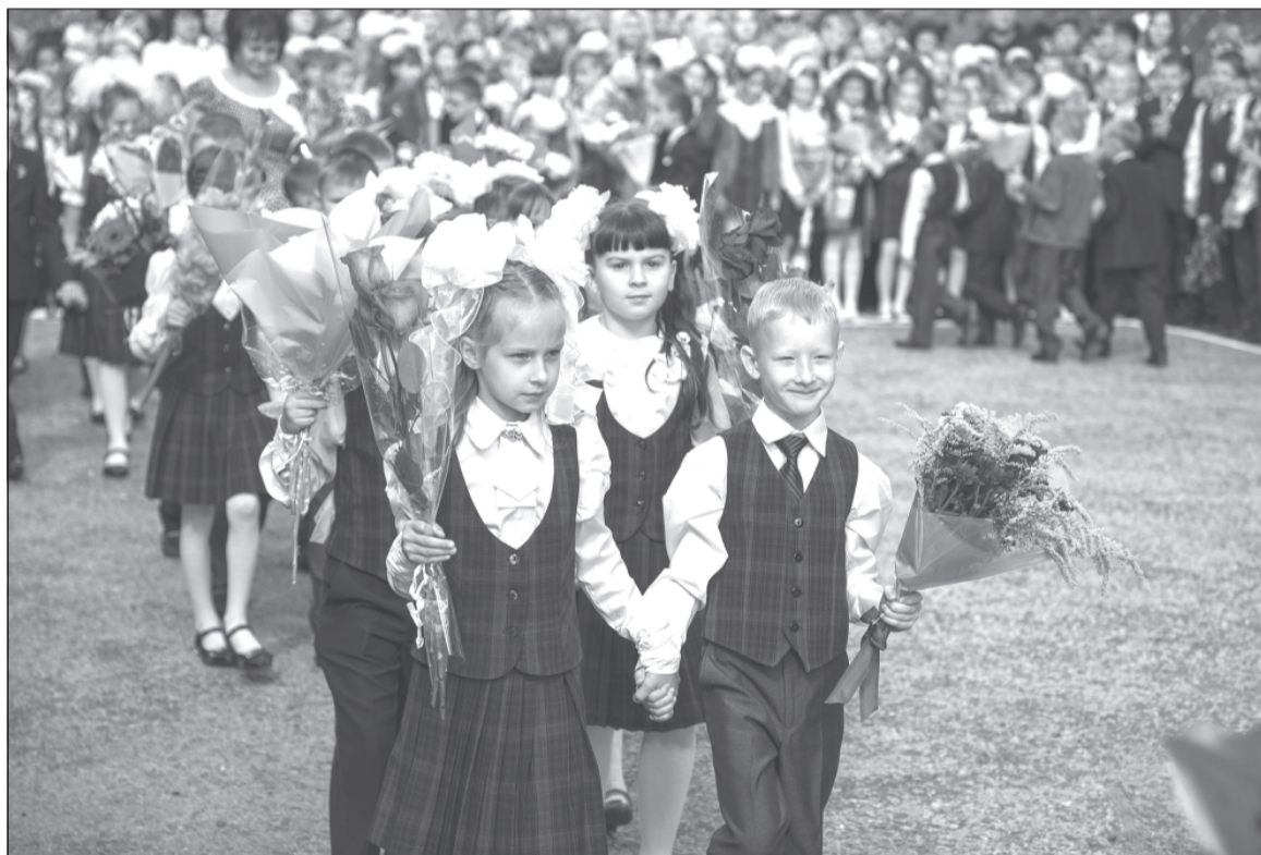
Так продолжают школьные годы