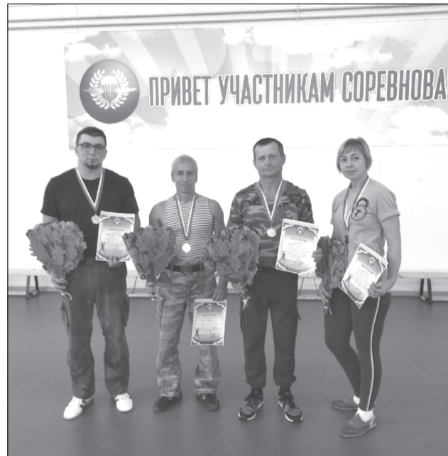
«Армейский рывок» покорился приволжским спортсменам

Спортсмены гиревого объединения «Олимп» старшим составом приняли участие в открытом межрегиональном турнире по Армейскому гиревому рывку, который проходил впервые на территории 331-го гвардейского парашютно-десантного полка г.Костромы.