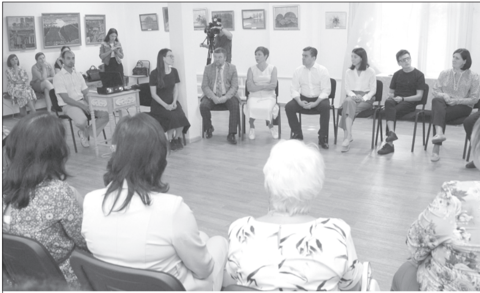
Станислав Воскресенский обсудил с жителями Шуи и Южи планы по благоустройству городов в рамках президентского гранта.

Губернатор Ивановской области Станислав Воскресенский встретился с жителями Южи и Шуи – городов, победивших в этом году на Всероссийском конкурсе проектов благоустройства малых городов и исторических поселений.