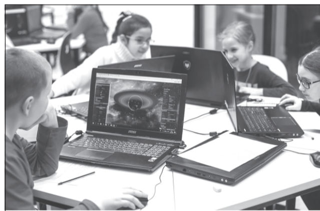
В школах создаётся цифровая образовательная среда