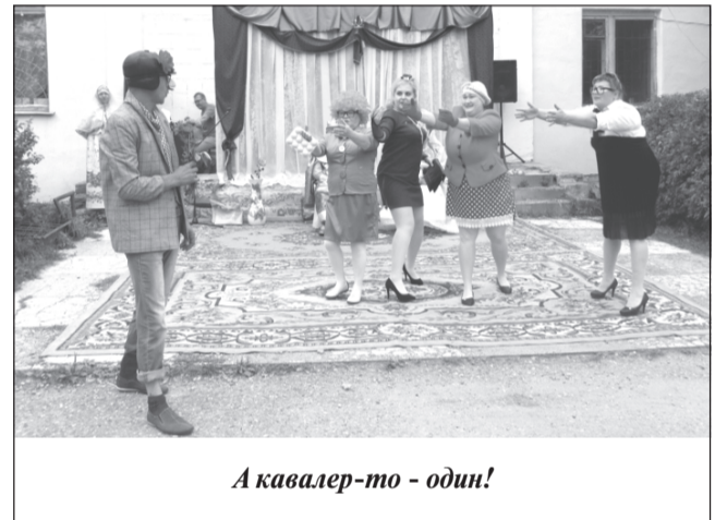
А кавалер-то - один!