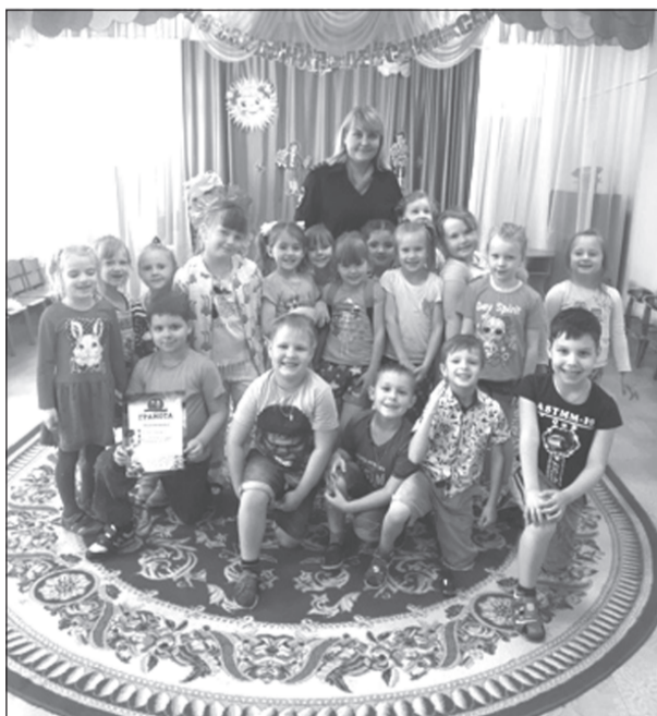
Ребята дали слово не нарушать правила дорожного движения

«Викторина безопасности» завершилась награждением команд. Сотрудники ГИБДД уверены, что использование игровой деятельности помогает формированию у дошкольников навыков безопасного участия в дорожном движении.